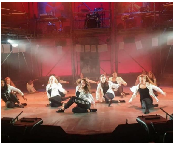
Foto: voorspeelavond door MT010-leerlingen

In het monumentale schoolgebouw van de Mavo voor Theater MT010 in Delfshaven wordt dit jaar gevierd dat deze kleinschalige school alweer vijf jaar bestaat. Het schoolteam is er hecht en energiek en de leerlingen gemotiveerd. Dat zij met elkaar een uniek onderwijsprogramma delen, is ook door de landelijke televisiepers opgemerkt. Eind mei besteedde het programma "Lekker in je vel" op RTL4 aandacht aan MT010 én aan de toegevoegde waarde van het kunstonderwijs.